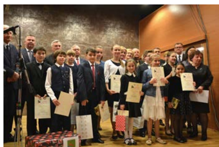
fol. Wspólna fotografia fundatorów nagród z laureatami konkursu