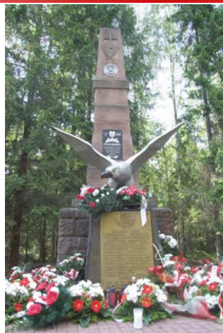
fot. Mogiła na Brzasku

Przypomnijmy: 29 czerwca 1940 r. w lesie Brzask pod Skarżyskiem hitlerowska policja dokonała masowej egzekucji 760 osób - mieszkańców Kielecczyny. Wśród