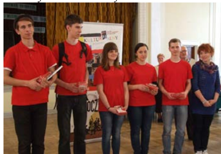
fot. To ta drużyna będzie reprezentowała powiat skarżyski na zawodach w Okręgowych Mistrzostwach Pierwszej Pomocy PCK w Kielcach