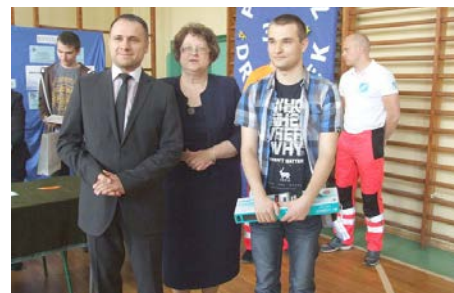
fot. Wiedza informatyczna zwycięzców tego konkursu jest na wysokim poziomie