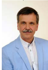
fot. Leszek Lepiarz dyrektor Szpitala Powiatowego w Skarżysku-Kamiennej im. M. Skłodowskiej-Curie

2015 r. do dnia zakończenia postępowania konkursowego i wyboru dyrektora ZOZ w Skarżysku-Kamiennej.