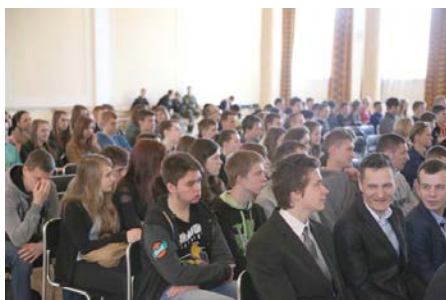
fot. Uczniowie podczas spotkania wysłuchali wielu informacji na temat funkcjonowania kolei.