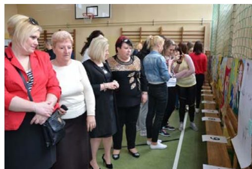
fot. Anna Leżańska, członek zarządu powiatu dokładnie obejrzała wszystkie prace zanim wytypowała, jej zdaniem, najlepszą.