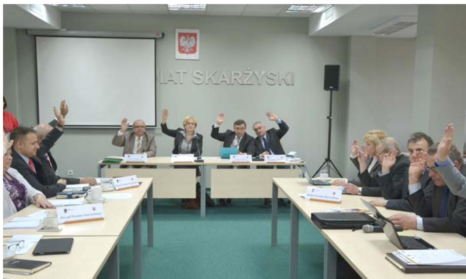
fot. Radni powiatu skarżyskiego głoszą nad uchwałami