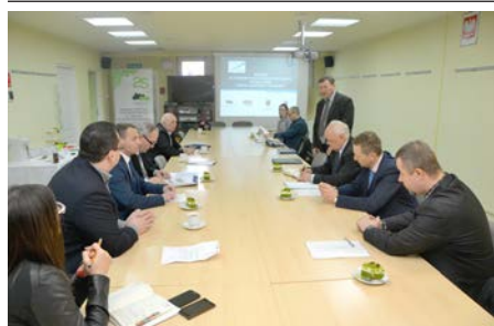
fot. Posiedzenie robocze Kapituły Konkursowej.

P owiatowy Urząd Pracy w Skarżysku-Kamiennej we współpracy z Starostwem Powiatowym w Skarżysku-Kamiennej, Urzędem Miasta w Skarżysku-Kamiennej oraz Fundacją Agencja Rozwoju Regionalnego w Starachowicach ogłaszają konkurs dla osób planujących założyć własną firmę „Pomysł na innowacyjny biznes”.