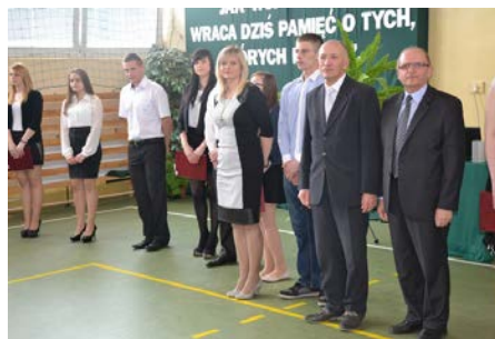
fot. Przedstawiciele Powiatu podczas uroczystości Dnia Patrona w skarżyskiej „samochodowce”