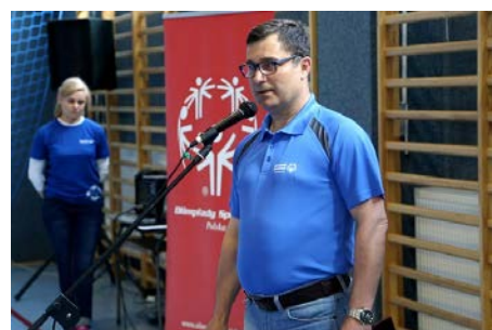
fot. Grzegorz Małkus, radny powiatowy, a zarazem prezes Oddziału Regionalnego Olimpiady Specjalne Polska – Świętokrzyskie