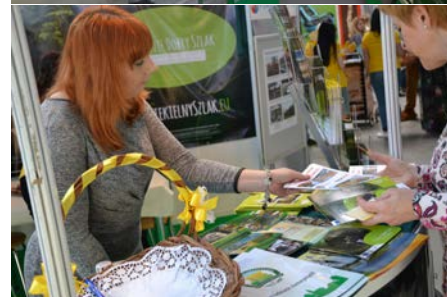
fot. Odwiedzający targi żywo zainteresowani byli ofertą turystyczną powiatu skarżyskiego