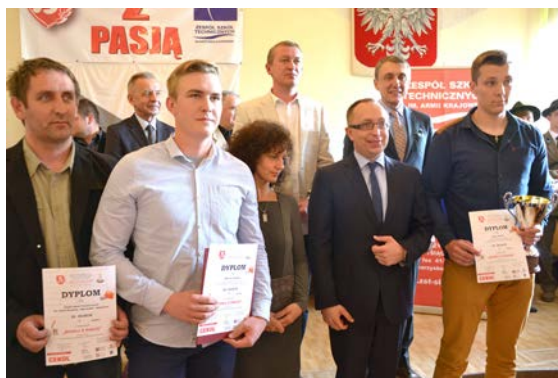
fot. Laureaci konkursu - zdobywcy nagrody głównej tuż po odbiorze zwycięskiego pucharu

Część teoretyczna olimpiady obejmowała wiedzę z przedmiotów budowlanych, gdzie należało wykazać się znajomością dokumentacji budowlanej,